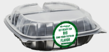
To-Go Container Stickers

PR support to include best practices, sample pitch, and a press release to announce your new menu item(s).