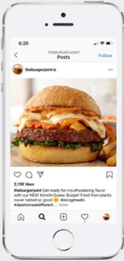
Social Media Posts