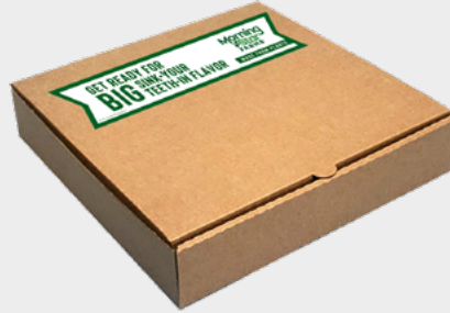
Pizza Box Decals